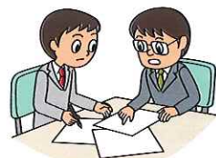
売上高減少の防止・軽減 営業継続費用